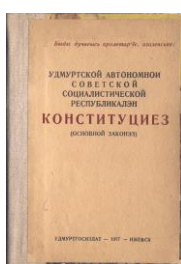
(Обложка Конституции 1937 г.)